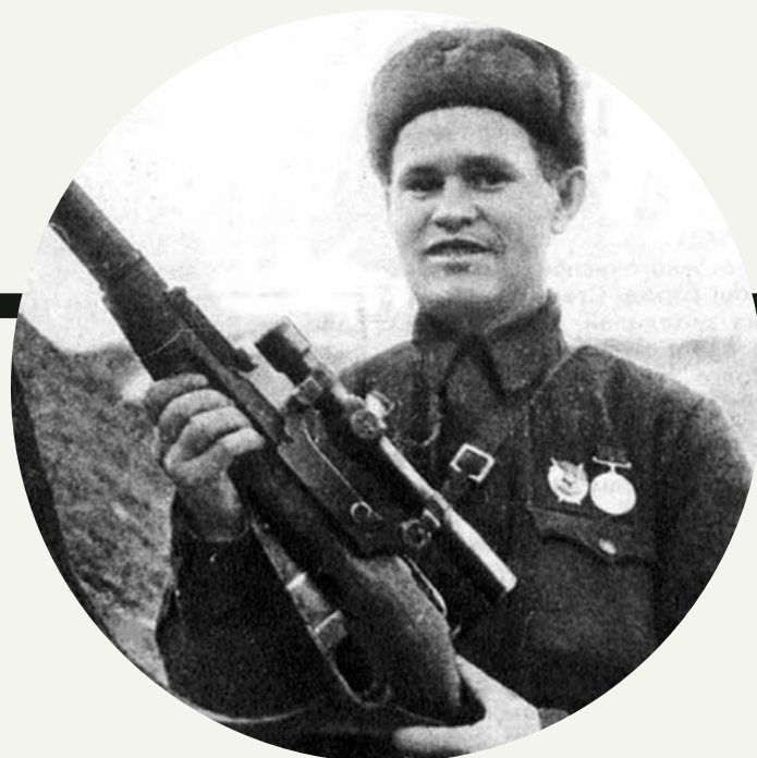
ЗАЙЦЕВ ВАСИЛИЙ снайпер 284-й стрелковой дивизии

Во время Сталинградской битвы с 10 ноября по 17 декабря 1942 года смог уничтожить 225 солдат и офицеров немецкой армии. Среди убитых им врагов - 11 снайперов, в том числе сам майор Кенингс, руководитель снайперской школы Вермахта.